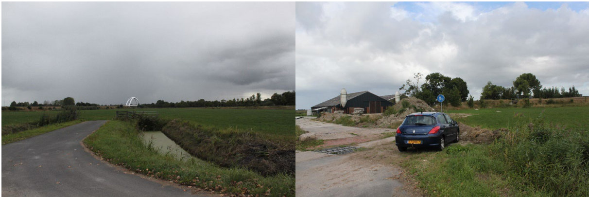
Afbeelding 1. Zicht over het plangebied vanaf het westen (links) en het agrarisch erf (rechts).