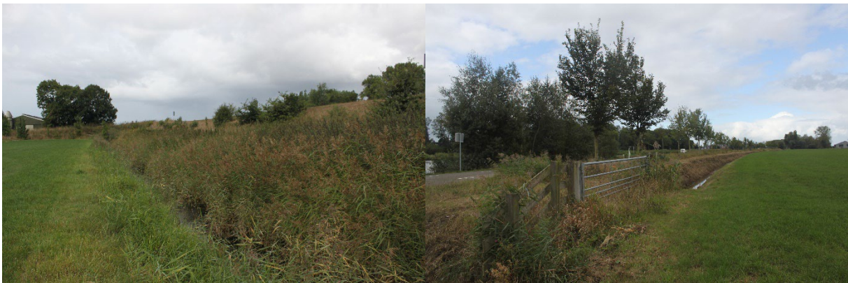
Afbeelding 2. De watergang aan de noordzijde met aan de linkerzijde de verhoogde spoorweg (links) en zicht op de weg langs de weg Van Starckenborghkanaal Noordzijde (rechts).