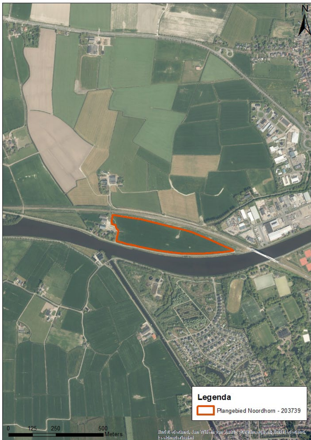
Afbeelding 3. Luchtfoto van het plangebied en de directe omgeving (ESRI, 2022).