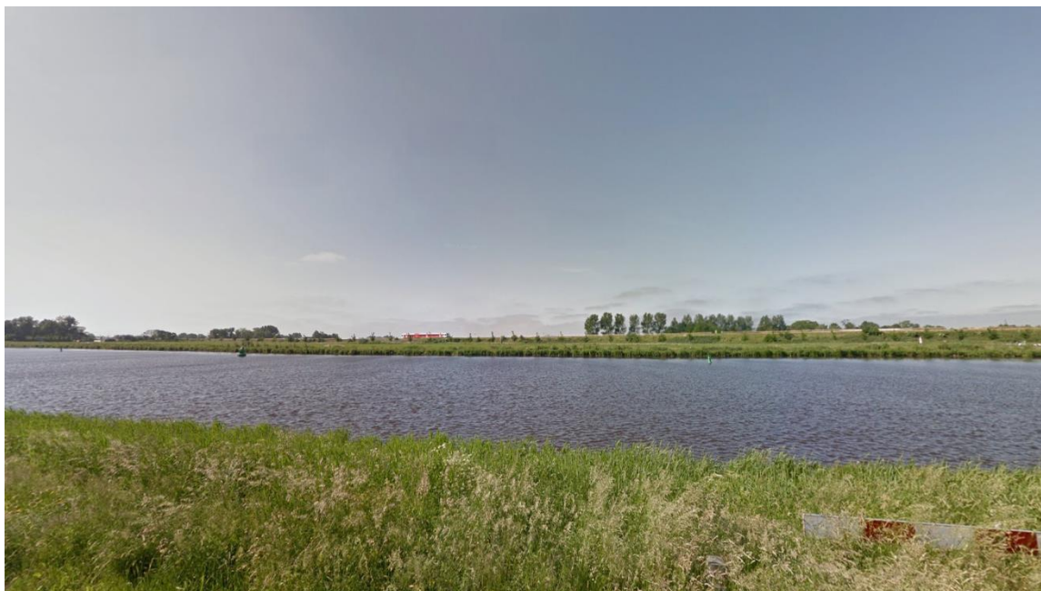
Afbeelding 4: Huidig uitzicht vanuit oostelijke richting vanaf Van Starckenborgh Zuidzijde