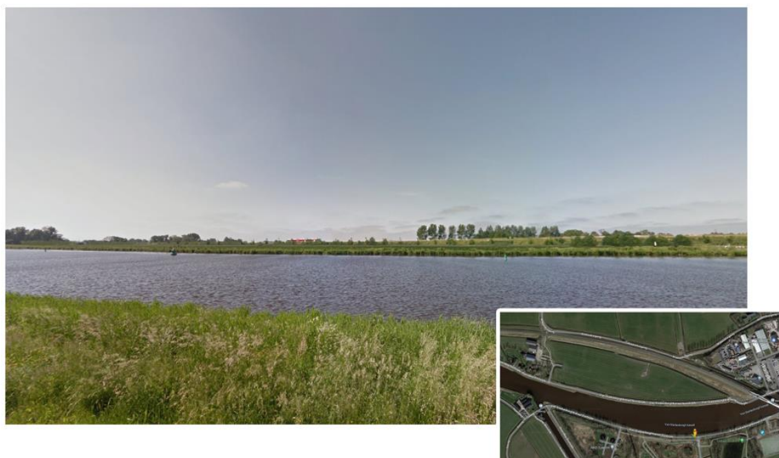
Afbeelding 5: Concept inpassing vanuit oostelijke richting vanaf Van Starckenborgh Zuidzijde