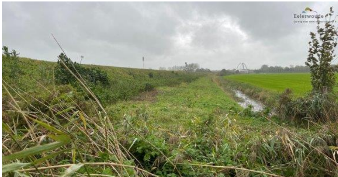
Afbeelding 2: Strook onder talud, aangekocht door de provincie voor het realiseren van het 'ommetje'