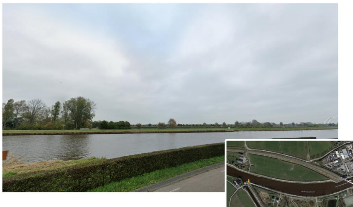
Afbeelding 7: Concept inpassing vanuit westelijke richting vanaf Van Starckenborgh Zuidzijde