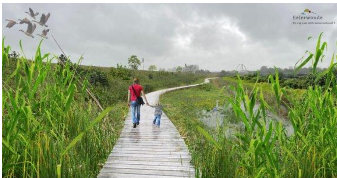
Afbeelding 3: Concept inpassing 'ommetje'