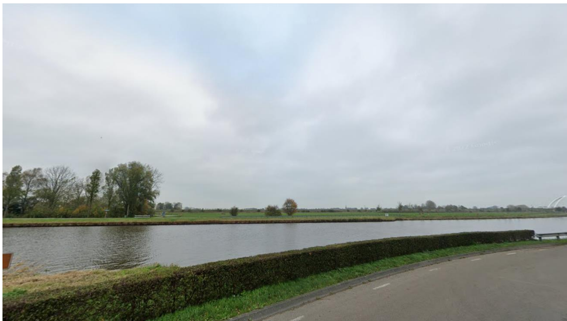
Afbeelding 6: Huidig uitzicht vanuit westelijke richting vanaf Van Starckenborgh Zuidzijde