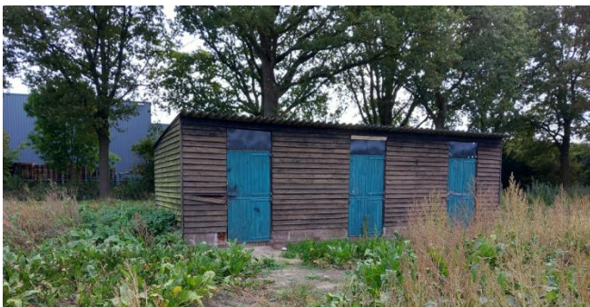
Figuur 7: Paardenstal in noordoosten plangebied