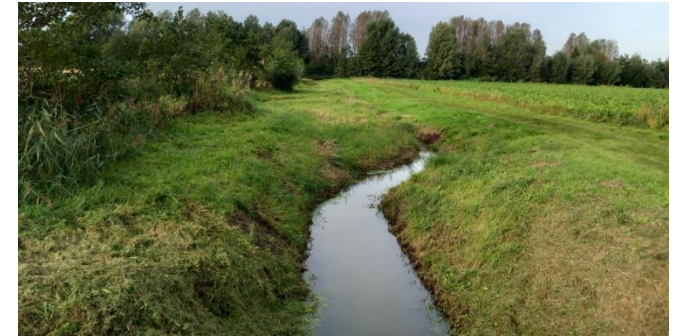
Figuur 5: Heerenbeekloop langs zuiden plangebied