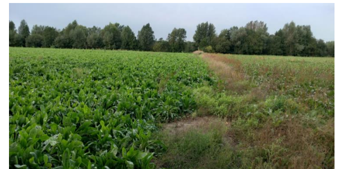
Figuur 9: Plangebied gezien vanaf laan oostzijde