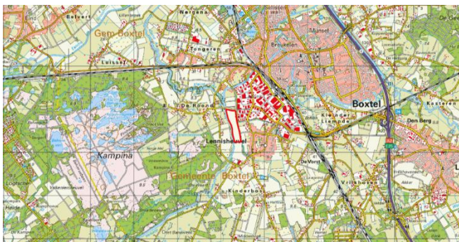
Figuur 1: Topografische kaart ligging plangebied (1:25.000)

Initiatiefnemer wil binnen het plangebied, op de thans onbebouwde gronden, een zonnepark oprichten van circa 12 hectare. Ter hoogte van de Pinkstelaarseweg zal een doorsteek, voor recreatief gebruik, naar de Beerze worden gecreëerd. Rond het gehele zonnepark zal ruigte begroeiing en struvelen worden aangeplant. Langs de westzijde van het plangebied worden enkele laagtes en poelen aangelegd met hier omheen boomgroepen, ter versterking van de natuurlijke waarden. Het deelgebied in het oosten zal natuurlijk worden