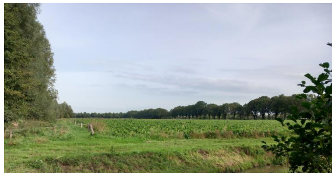
Figuur 8: Westgrens plangebied