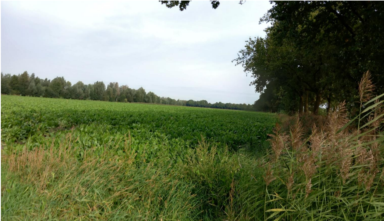
Figuur 4: Plangebied gezien vanaf zuidgrens