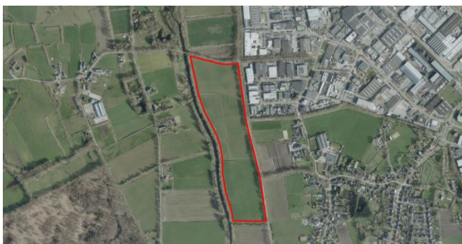
Figuur 3: Luchtfoto plangebied en directe omgeving ingericht. Figuur 2 geeft een conceptueel beeld van de toekomstige situatie.