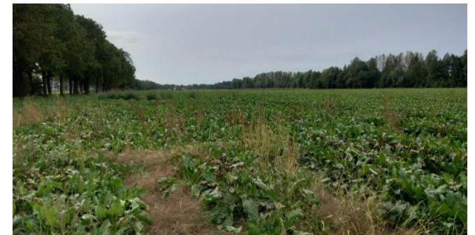
Figuur 6: Plangebied gezien vanuit het noorden