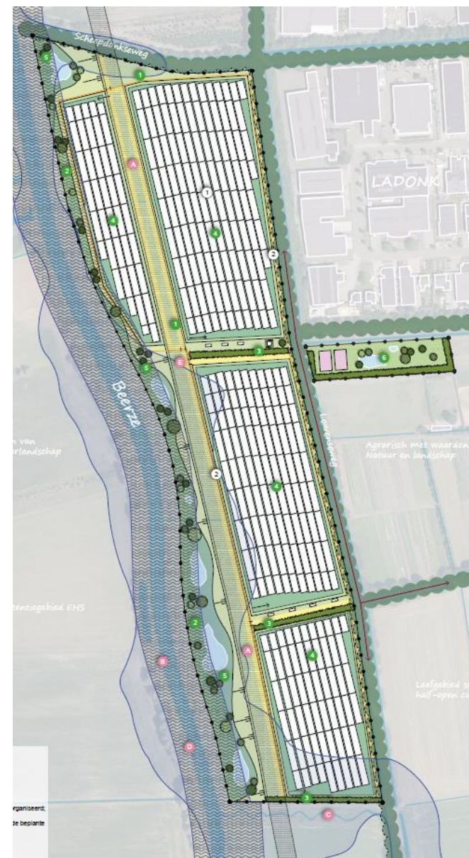
Figuur 2: Concept toekomstige situatie plangebied